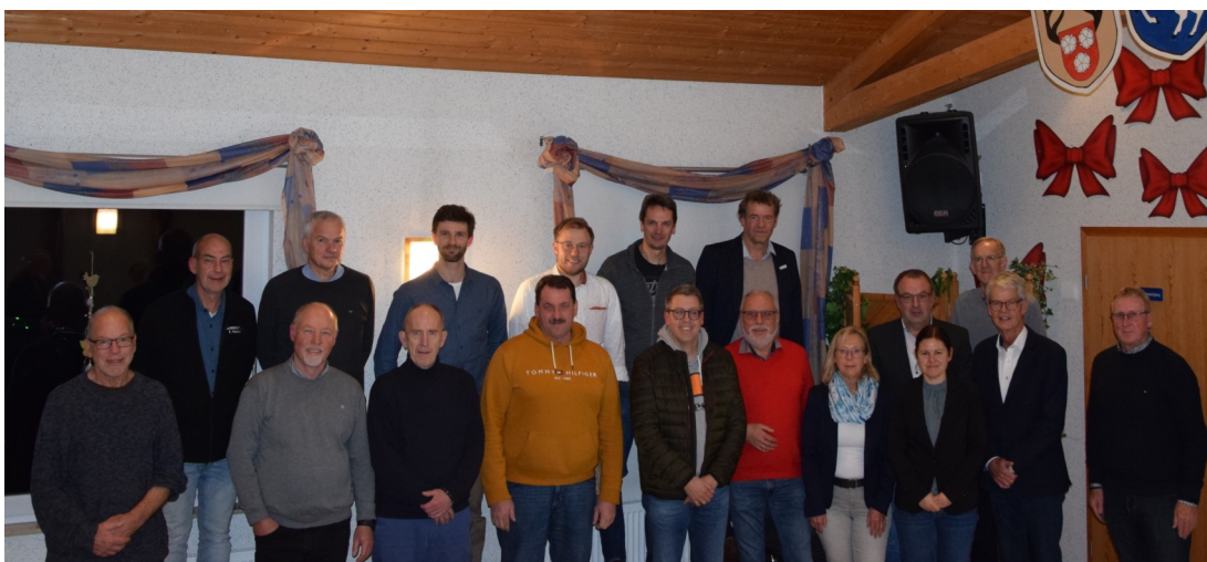
Lokale Aktionsgruppe Östliches Weserbergland auf der Sitzung am 21.11.23 in Brünnighausen (unvollständig)

Neugierig auf LEADER? Dann schauen Sie auch gern auf unsere Homepage: www.leader-oestliches-weserbergland.de